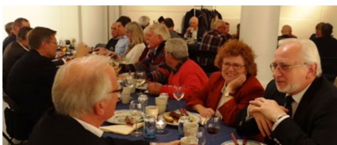
Middagen på lördagskvällen.