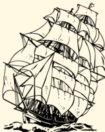
Bild 5. Skepp eller segelfartyg