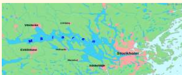
Bild 2. Sjön Mälaren