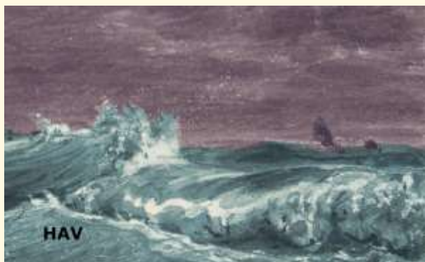
Bild 3. Hav